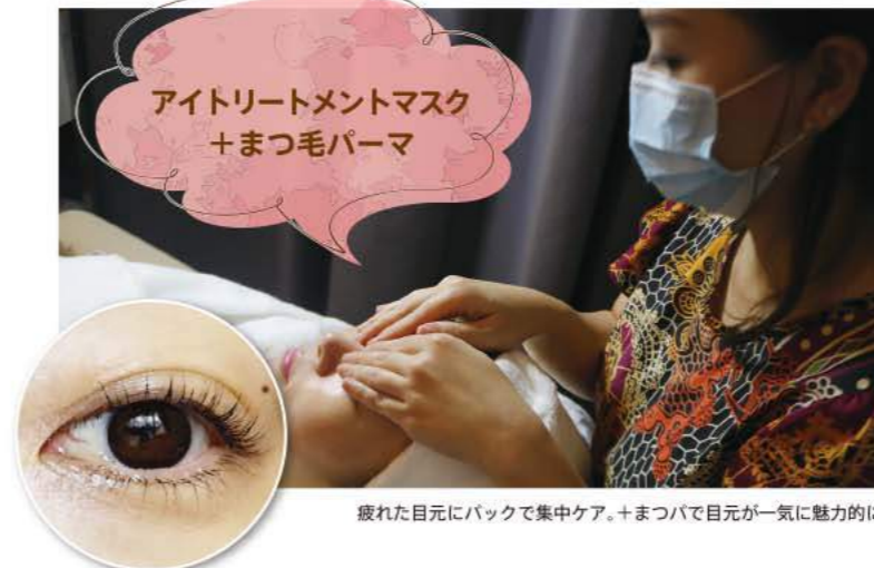
疲れた目元にバックで集中ケア。+まつ毛パーマで目元が一気に魅力的に。