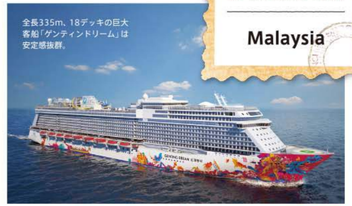
全長335m、18デッキの巨大客船「ゲンティンドリーム」は安定感抜群。

391 A Orchard Rd #09-03 Ngee Ann City Tower A ☎ 6732-1511 Email: ysi@ytk.co.jp www.yusenttravel.sg 9:00~18:00 (昼休み12:00~13:00) 土日祝休 ※ご不明な点はWEBまたは日本人スタッフまでお問い合わせください