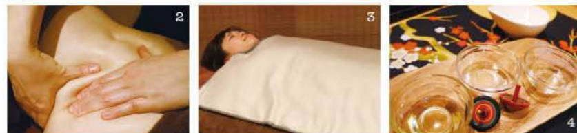
1,2,3,4.「デトックストリートメント」ではヒートマットでしっかり発汗してから、もみほぐし。5.「コラーゲンマシン」で新陳代謝をアップ。「デトックストリートメント」と組み合わせると、相乗効果大。6. 憎き脂肪を分解する最新「キャビテーション」。