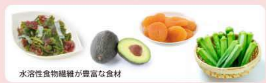
水溶性食物繊維が豊富な食材

健康的な生活習慣に必要な食物繊維には不溶性と水溶性の2種類があり、後者は不足しがちなものです。水溶性の食物繊維は、糖質吸収の緩和、整腸作用、脂質を吸着して排泄を促す働きがあり、積極的に摂取したい栄養素。当地で手に入りやすい水溶性食物繊維を多く含む食材は、海藻、オクラ、アボカドやアプリコットなど。ドライアプリコットのオリーブオイル漬けはオヤツに◎、スイーツの代わりに食物繊維を摂って健康に。