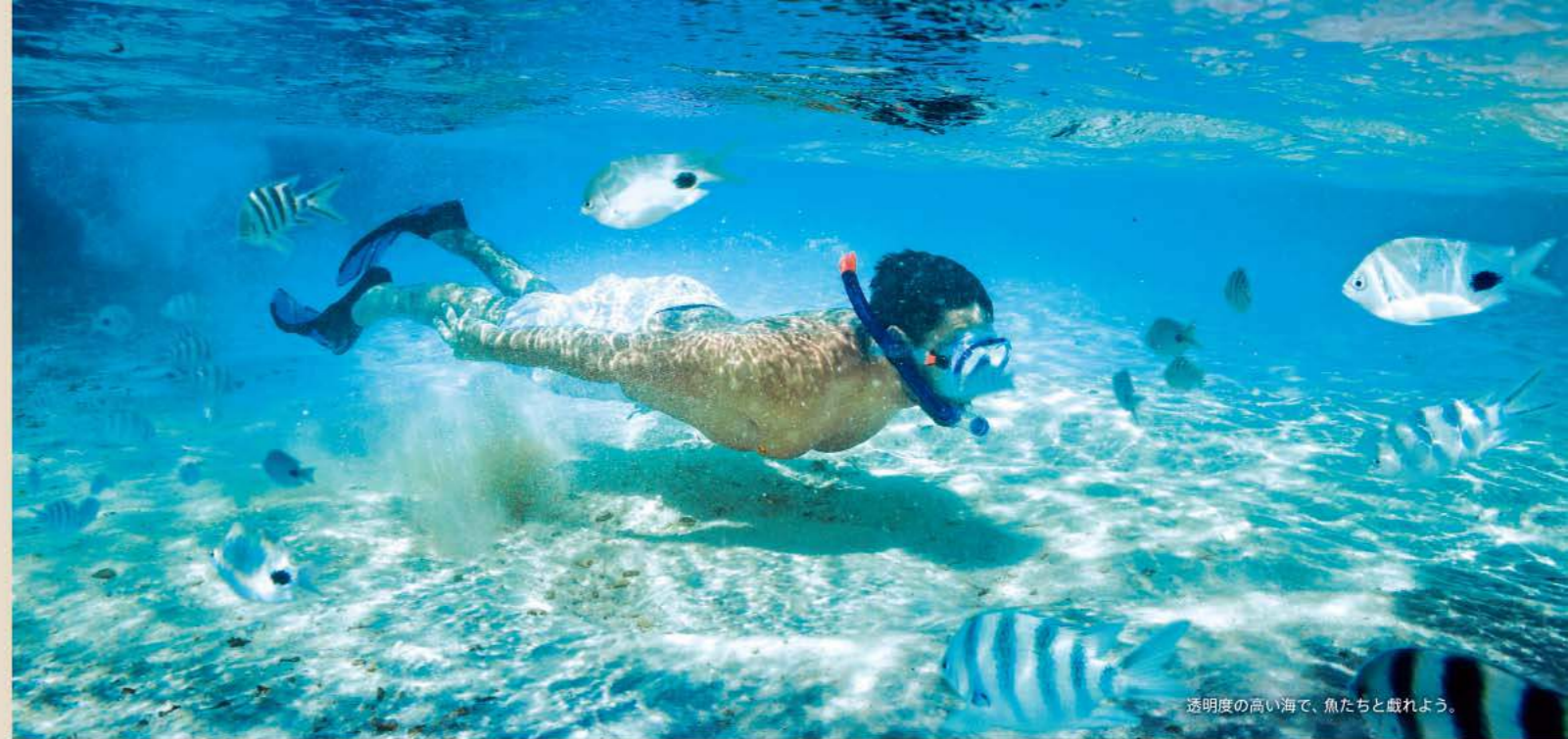
透明度の高い海で、魚たちと戯れよう。