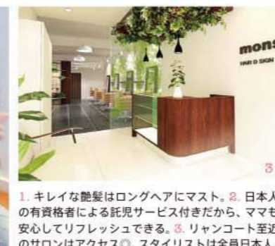
1. キレイな艶髪はロングヘアにマスト。2. 日本人の有資格者による託児サービス付きだから、ママも安心してリフレッシュできる。3. リャンコート至近のサロンはアクセス◎。スタイリストは全員日本人。