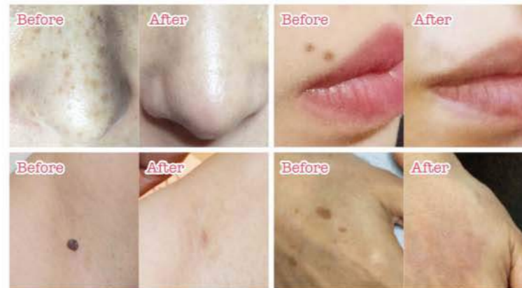
顔だけでなく全身OK！除去前と後の印象の変化に驚き。