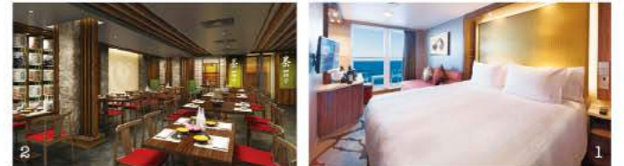
1. 客室の選択肢も豊富。バルコニー付客室なら大海原と満天の星空を独り占め！2. 無料の指定レストランの他、本格的な日本料理や多国籍料理が楽しめる有料レストランも。3. 大自然と美しい海のハーモニーが最大の魅力。"免税の島"ランカウイ。お酒が安い！