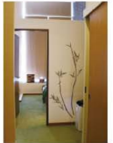
和テイストのデコレーションが施された落ち着いたサロン。

芸能人やスポーツ選手も訪れる「フェイスシア」銀座本店は、LTG Spa & Wellness Awards 2018 等受賞歴多数。姉妹サロン「恵比寿スローライフ」はアットコスメ・ベストサロンアワード2年連続関東1位。シンガポール店もオープンからわずか4か月でTripAdvisorバイザー416サロン中14位に急上昇し、ローカルの間でも話題沸騰中。