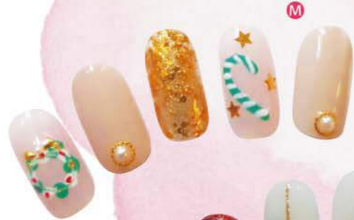
③ トレンドのスモーキーピンクに、キャンディーやリースでオトナ可愛いデザイン。