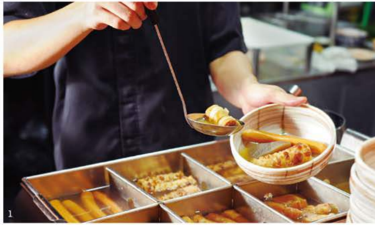
5 Magazine Rd #01-01 Central Mall (Clark Quay駅7分) ☎ 6533-0266 18:00~翌4:00 日休 FB: MANPEISINGAPORE ※最大16名の個室あり