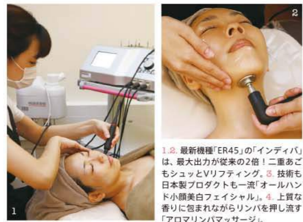
1,2. 最新機種「ER45」の「インディバ」は、最大出力が従来の2倍！二重あごもシュッとVリフトアップ。3. 技術も日本製プロダクトも一流「オールハンド小顔美白フェイシャル」。4. 上質な香りに包まれながらリンパを押し流す「アロマリンパマッサージ」。