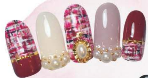
① 深いワインのようなホルダーのツイード柄とパールで女子力アップ!