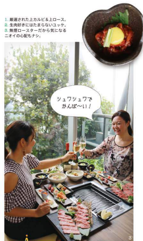
シュワシュワかんば〜い!