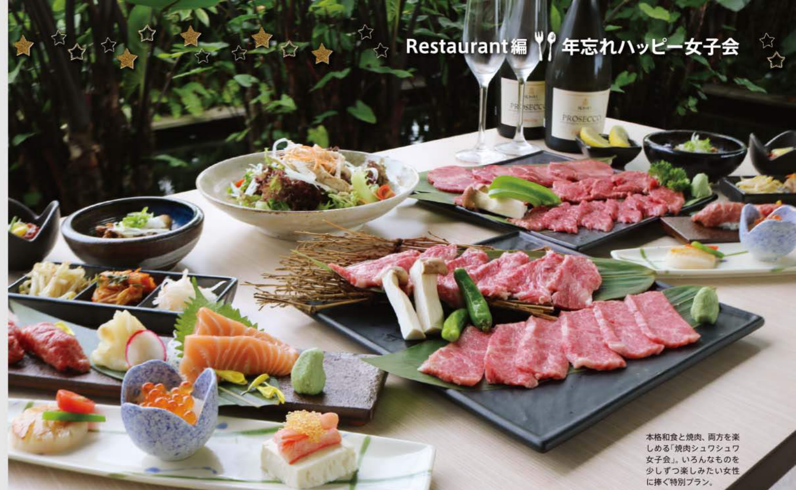
本格和食と焼肉、両方を楽しめる「焼肉シュワシュワ女子会」。いろんなものを少しずつ楽しみたい女性に捧ぐ特別プラン。