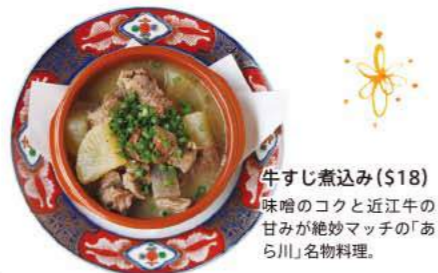
牛すじ煮込み($18) 味噌のコクと近江牛の 甘みが絶妙マッチの「あ ら川」名物料理。

150 Orchard Rd #01-34 Orchard Plaza (Somerset駅5分) ☎ 6733-0107 12:00~14:30(LO)、18:00~22:00(LO) 日休 FB: arakawasingapore ●お任せコース($80/$130)