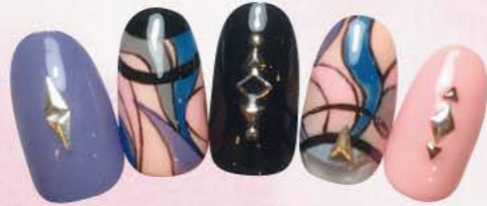
ブラックを効かせたブリッチ柄ネイルで、大人レディな指先を演出。