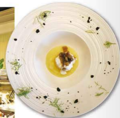
芸術家の顔も持つシェフが奏でる料理の数々は、舌も目も楽しませてくれる。

45 Amoy St (Telok Ayer 駅5分) ☎ 6260-0762 Email: info@soloristorante.com ランチ 月~金 11:45~14:00 (LO) ディナー 月~土 18:00~22:00 (LO) 土ランチ、日休 www.soloristorante.com