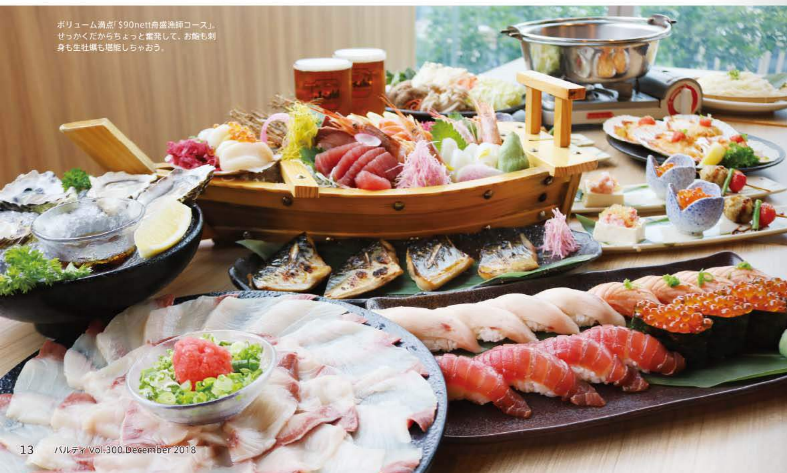
ボリューム満点「$90nett船盛漁師コース」。せっかくだからちょっと奮発して、お籠も刺身も生牡蠣も堪能しちゃおう。