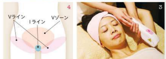
1,2. オーガニックスクラブ+クレイマスクで、誰もが羨む背中美人に。3,4. 一番人気のIPL脱毛は痛みゼロ。黒ずみもキレイに。5. 技術も日本製プロダクトも一流「オールハンド小顔美白フェイシャル」。

12 Gopeng St #01-61/63 Icon Village (Tanjong Pagar駅5分) ☎ 6225-0722/8111-1856 (SMS) 11:00~20:00 FB: Body Spark SG