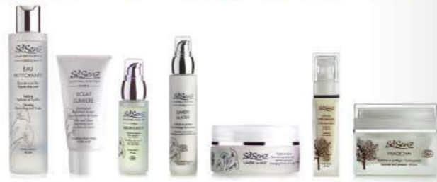
肌に必要なものを厳選したシンプルなプロダクトラインナップ。