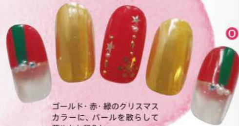
④ ゴールド・赤・緑のクリスマスカラーに、パールを散らして華やかな印象に。