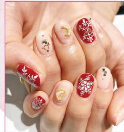
⑬ 手描きの繊細な雪の結晶にうっとり。三日月や星が煌めき、聖夜にぴったり。