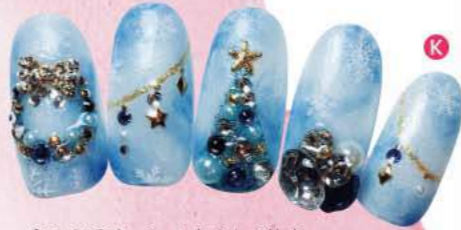
② 冬のイルミネーションをイメージした、水色ベースの大人キラキラネイル。