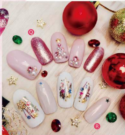
⑤ 透明感のある赤紫フレンチに、繊細な雪の結晶を散らしてロマンティックに。⑥ 華やかなシャンパンピンクで心もウキウキ。大人も挑戦しやすい洗練パーティーネイル。⑦ 白ベースにカラフルなメタリックテープやストーンでパーティー気分全開!