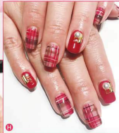
⑭ 冬らしい赤のタータンチェック柄を、甘くなりすぎない絶妙なアレンジで。