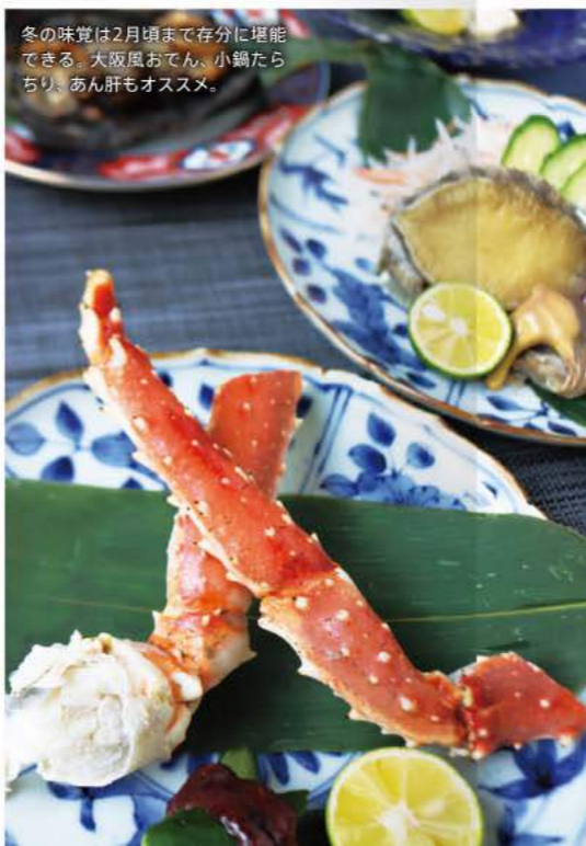
冬の味覚は2月頃まで存分に堪能 できる。大阪風おでん、小鍋た ちり、あん肝もオススメ。