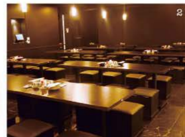
1. 楊貴妃も食べていたナツメやクコなど、美容に効く食材たっぷりの「薬膳もつ鍋」。2. お座敷もあるから子連れ宴会にも最適。3. 「薬膳もつ鍋」の食べ放題を注文すると、豚肉も楽しめちゃう。4. 試食した営業Hも激おし！女子ウケ100%保証。