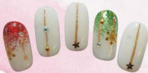
ホワイトベースでシンプルながら程よいキラキラ感。ゴールド縦ラインは指長効果も。