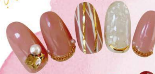
⑧ 肌になじむピンクカラーに、ゴールドで華やかさをプラス。シェルが光を受けてキラキラ。