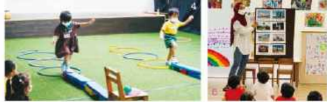
1. 五感を刺激する外遊びは、この時期大切な活動の一つ。イースト校の園庭では、固定遊具だけでなく、サッカーや跳び箱、砂遊びなども。2. ウェスト校の園舎近くのOpen Fieldで外遊び。散歩中、リスやオオトカゲに遭遇することも。4. 大切なことは、活動を楽しむ中で「もっとやりたい!」「もっと上手になりたい!」という意欲を引き出すこと。5. 日本の行事だけでなく、様々な行事を通して異文化に触れる機会も。