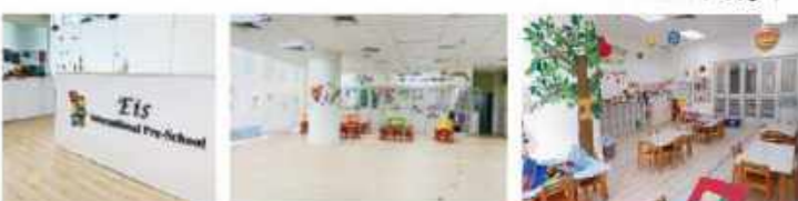
どの部屋も窓が大きくて明るいウェスト校。園児が心地よく過ごせる設備が整う。