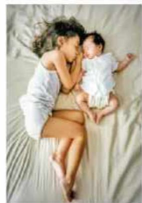
精進で眠る姿を見ると幸せに。

沐浴の指導など、夫婦セミナーが充 実。そして産後の入院中、夫も病院 に宿泊可能でうれしかったです。病 院にもよりますが、授乳のとき以外、 赤ちゃんを預かってもらえます(同室 希望も可)。中華、マレー、インド、 欧米など入院食のバラエティーが豊 富で、漢方の産褥食も選べます。