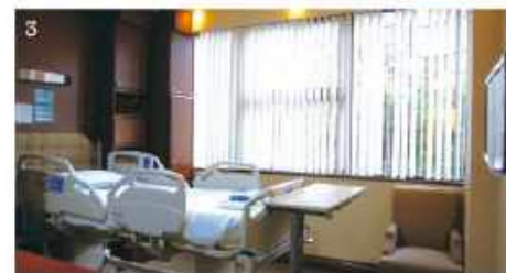
1. 笑顔で緊張を和らげてくれるタン先生。2. 日本の雑誌や絵本が揃う、アットホームな雰囲気のある待合室。 3. 明るく清潔なグレンイーグルスの個室。検査や入院の際に移動が少なく、産後も快適。4. 美容サロンでも使用されるラジオ波による肌の引き締めマシン。マタニティ・パッケージには産後2回の施術が含まれる。