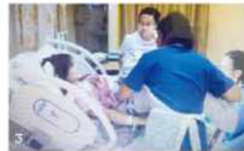
信頼できる素子先生や看護婦さんに生まれ、出産直前は思えば和やかなムード。産後、赤ちゃんをキレイに洗ってタオルでくるみ、ママの元へ。