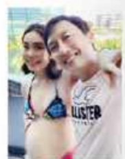
出産準備を通し、ご主人とより仲良しに。

「痛み」という言葉を使わない、力ませないでほしい!「出産直前まで温かいお湯に浸かっていたい!」「キャンドルを焚きたい!」など、多国籍なこともあり、さまざまなリクエストにOKをいただけました。