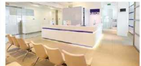
最新の医療施設が集まるメディカルハブ「ノヴェナメディカルセンター」内にあり、検査等もスムーズ。

また、妊娠前に子宮や卵巣に病気がないか調べておくことをお勧めします。妊娠がうまくいかない原因になるものがないか、また妊娠後に病気が判明して治療について悩んだり、妊娠中のトラブルの原因になるものがないかをチェックしておくといいですね。