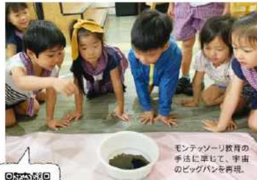
モンテッソーリ教育の手法に準じて、宇宙のビッグバンを再現。