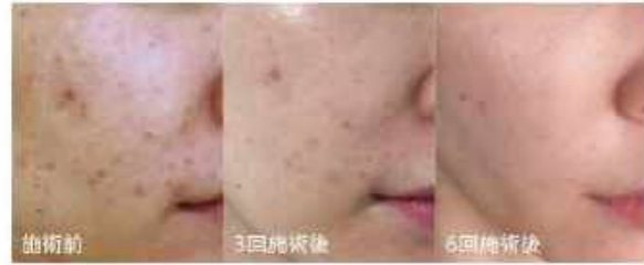
6回のフェイシャルで頬全体に広がっていたシミが兎事に改善。

とにかく驚きの効果です。 1回の施術でくすみがあるみ取り、 顔が5~6歳若返った感じ。 (39歳、女性)