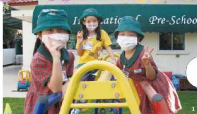
遊びは学び、 全力で遊ぼう！