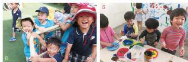
1. 園舎の下に広がる広大な芝生フィールド。健康管理、水分補給、虫除け、運動後のシャワーなどサポートも万全。2. 半屋内の遊具も大人気。3. 子どもたちの好奇心を引き出す多彩なプログラムを展開。 ※写真はCB前の風景です。現在、スタッフおよび2歳以上の子どもはマスク着用が義務付けられています

200 Turf Club Rd #06-03 The Grandstand (North Grandstand LIFT2から6階へ) ☎ 6466-7011 Email: info@kizrookinder.com www.kizrookinder.com