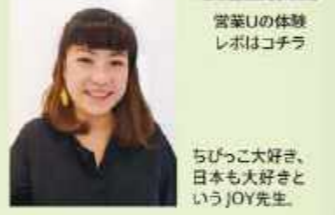
営業Uの体験 レポートはこちら