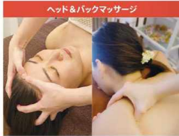
ヘッド&バックマッサージ

81B Tanjong Pagar Rd 3F (Tanjong Pagar 駅3分) ☎ 6329-1166 / 9858-6458 (日本語可/SMS予約可) Email: reserve.qmsln@queensmarket.biz 10:00~20:00 (土日は19:00まで) www.queensmarket.sg FB: QueensMarket.SG