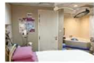
分娩室はバスタブ付きのお部屋をチョイス。

日本では、体重や食事に制限があると聞きますが、私のドクターは食べたい物を食べてよし!と。お陰で臨月までに15kg増えちゃいました。