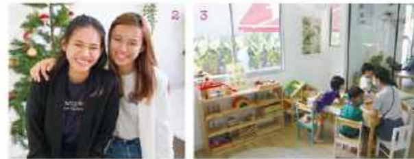
※写真はCB前の風景です。現在、スタッフおよび2歳以上の子どもはマスク着用が義務付けられています

◎ 206 Ponggol Seventeenth Ave ◎ 166 East Coast Rd ☎ 9424-1961 www.thegrowingacademy.sg