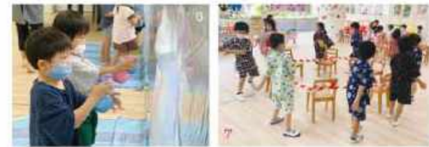
6. 毎年8月に行っているサマープログラム。毎日異なるSpecial Activityを楽しみ、7. 盆踊りやゲームをしたり、アイスクリームやポップコーンを食べて、お祭り気分を満喫。