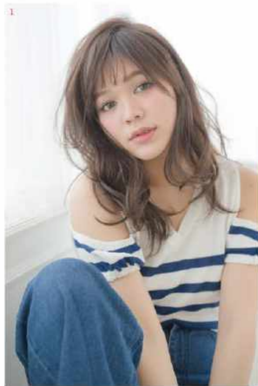
1. 抜け感のあるパーマと透明感カラーでイメチェン。2, 3. 美髪のエキスパートMatsunagaさんとMegumiさん。4. トマトやレタス、アロエなど野菜エキスで地肌を優しくケアする日本製「viege」。とくに細毛さんにオススメ。5. レモンイエローが爽やかなサロン空間。

402 Orchard Rd #05-25 Delfi Orchard (Orchard駅10分) ☎ 6733-0331 (日本語可) / 9711-9295 (日本語SMS可) 10:00~20:00 (最終受付19:00)。土日祝は19:00まで (最終受付18:00) 月休 LINE: kanshasg www.kanshahair.sg FB: KANSHAhairdesign from Japan ※Free Wi-Fiあり ※スタイリスト募集 (フルタイム・パートタイム)