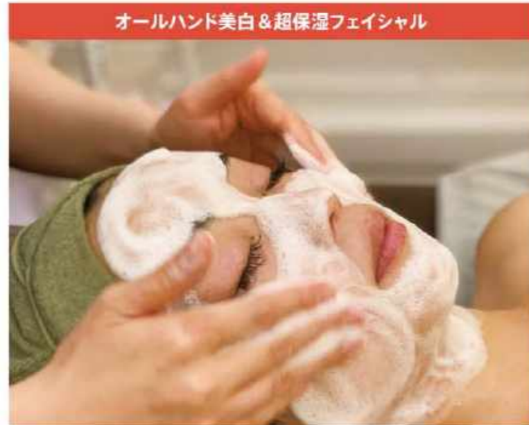
オールハンド美白&超保湿フェイシャル

こんなに広範囲を丁寧にマッサージしてくれるとは! と感動の60分。首の付け根→腰→胸→首肩→デコルテ→顔ケア。秘儀「肩甲骨はがし」は肩コリや猫背を改善。