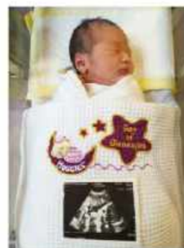
入院中、生まれたばかりの姿をパチリ。

「子どもは自分のタイミング、生まれてみたい方法を選んで生まれてくると学び、人間として本来備わっている力を信じて、私が陣痛の波に乗ることで子どもの生まれてくる力をサポートしたいと思いました。そのため、妊娠前から食事や身体作りを意識し、医療介入が少ない形を希望しました。