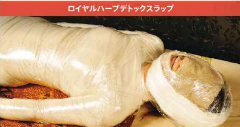
ロイヤルハーブデトックスラップ

体内に溜まった毒素を排出し、頑固なコリやむくみを改善するのにもってこいの指輪「ミラ瘦身」。豪華の宝庫といわれるタイ北部で育った天然ハーブとミネラルを贅沢にブレンド。特殊ラップを巻いて皮下組織へ浸透させた成分が3日間にわたり体内の毒素や脂肪を分解し続け、汗や尿としてごっそり体外へ排出。過酷な環境を生きて強くハーブは強力な抗酸化作用があり、美肌効果も絶大!