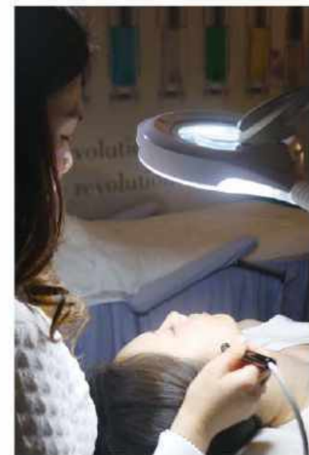
術後5~10日ほどでかさぶたが取れてキレイに。目の下のポツツ粒種なども除去可能。

14 Scotts Rd #04-05 Far East Plaza ☎ 6732-0006 10:00~20:00 (最終受付19:30) Email: elaine@pointdbeaute.com www.pointdbeaute.com FB: Point D'Beaute ●眉アートメイク $680/2回 ●シミ・ホクロ除去 $10~