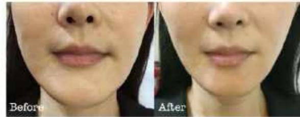
たった1回の小顔骨格矯正でエラ張りが改善され、輪郭がシャープに。

長年の肩こり、 偏頭痛、 顔面神経痛の悩みが、 ヒタリと止まりました。 (45歳、男性)