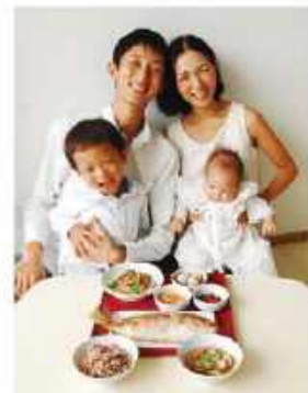
ママが前よりよくなって、海外でも日本の伝統行事「お食い初め」を用意。

ヘルパーや産後ママさんなど産後のサポート体制の選択肢が多いシンガポール。我が家は出産直前に雇ったヘルパーさんのおかげで、産後も余裕をもって乗り切れました。病院では多民族国家だからこそ出産に対してどんなリクエストも受け入れてもらえる柔軟性があり、日本で叶わなかった出産直後の過ごし方ができました。