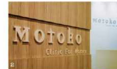
多くの日本人妊婦さんの海外出産をサポートしてきた素子先生。心配事にも日本語でしっかり対応。院内は清潔感があり、落ち着く空間。オーチャードで通いやすいポイント。

290 Orchard Rd #11-13/14 Paragon Medical Centre ☎ 6838-5366(日本語可) 月火木金 9:00～13:00、14:00～17:00 水 9:00～13:00 日休 www.motokoclinic.com