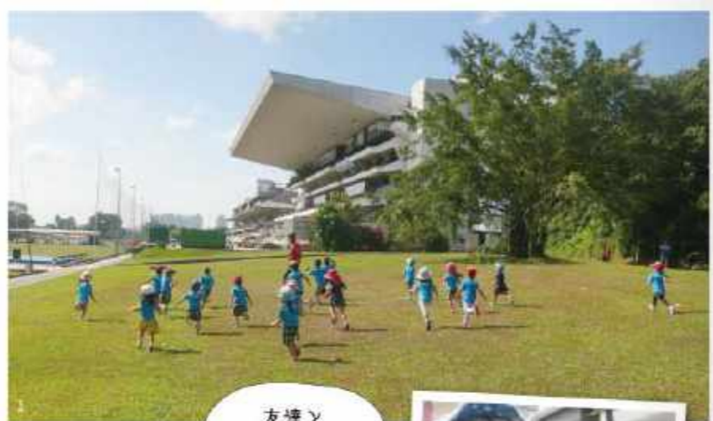
友達と いっぱい遊べて 楽しいよ