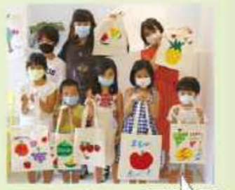
営業Uも体験、「大人も 重心に戻って没頭でき ました!」

b.studio BYST「アート教室」 Blk 34 Upper Cross St #04-150 (Chinatown 駅3分) ☎ 8138-4613 (WhatsAppのみ/日本語可) ● トライアルパック $60/2回(人) ● 5回チケット $180($36/回) ※ トライアル受講後、継続希望の場合は会員登録($50)が必要 ● レッスンスケジュール: 毎週土曜 13:00~ 内容: アクリルペイント、トートバックペイント、パティックペイントなど ※ 詳しくは「byst アート教室」で検索!