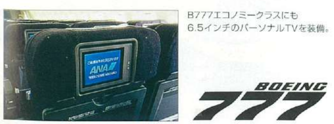
B777エコノミークラスにも6.5インチのパーソナルTVを装備。

ボーイング777(トリプルセブン)就航 関西線に就航するボーイング777はエコノミークラスにもパーソナルTVを導入するなど、機内エンターテイメントも充実。電話、FAXも搭載してみなさまのご利用をお待ちしています。