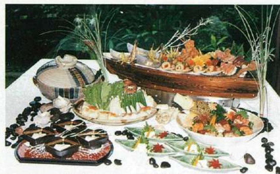
寄せ鍋コース・河豚鍋コースの中より

アクセス タンゲリンロードとオーチャードロードのほぼ真ん中にあるデルフィ・オーチャードの6F。オーチャードホテルの隣。MRTオーチャードから歩いて7〜8分。