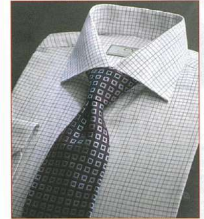
△David & John Andersonのコットン生地仕様で長袖/$275、半袖/$255

シーワイシー ザ カスタムショップ カスタムメイド シャツ www.cycustomshop.com #02-24 Raffles Hotel Arcade TEL: +65-6336-3556 FAX: +65-6338-5283