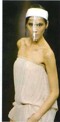
▲2004年4月に行われたシンガポールファッションフェスティバルにも出品。ショーでは魅せることを重視したものが目立ちます。

働か現代女性をターゲットに、1994年にオープンしました。黒を基調にシンプルでデザインが特徴的。動きがなくて女性らしさを引き出せるようなスタイルを提案します。一本筋の通ったブランドコンセプトのうえに流行をとりいれています。チーフデザイナーのConnie Kohはマネキンのコーディネートや店舗の内装までトータルデザインをします。商品は主に$50前後と気に入れば迷わずに手に入る値段設定です。シンガポールに7店舗、インドネシア、タイ、フィリピン、台湾、中国に