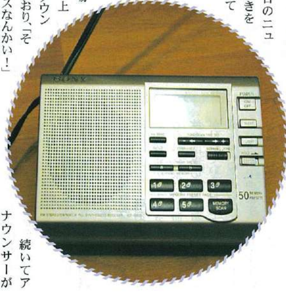
続いてアナウンサーが

旅をする上で役に立つと噂されたこのコラムは終了だが、非常に役立つ上記「海外安全情報をふまえて、安全で有意義な旅をみなさんには続けて欲しいとせつに願う次第なのである。