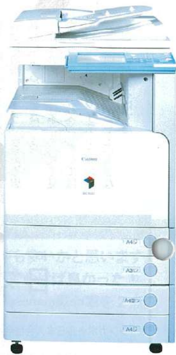
▲デジタルカラー複合機 IRC 3100

Work Harder! Play Harder! 仕事と遊びにけじめをつけて、仕事の時は遊ぶ自分を創る。つまり、ビジネスキャリアを作る。例えば、プレゼンの時など、本来は恥ずかしいが、人前では上がってしま