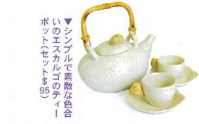
▲エスカルゴのティポット(セット$95)