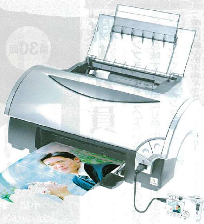
▲超写真画質プリンター i990