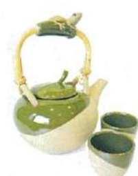
▲カエルが取っ手についたティポット(セット$75)

「LIM」のは、ユニークなエスニック雑貨の専門店です。世界中から集められた雑貨は1万アイテム以上、1200平方フィートの店内にぎっしりとディスプレイされています。最近のホットな話題は、新しいティポットセット5タイプを入荷したこと。なかでもおススメはカエルが取っ手についたティポット(セット$75)と、シンブルで素敵な色合いのエスカルゴのティポット(セット$95)。いずれも素材で自然派のデザインが特徴です。6月1日より7月25日まではグレートシンガポールセルにちなんで20%(各種制限あり)のプロモーションも実施中です。