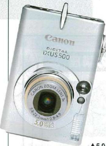
▲5.0メガ デジタルカメラ IXUS 500