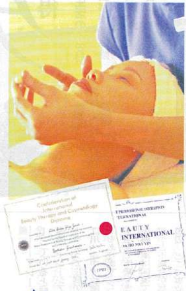
▲CIBTACやIPTIのディプロマがとれます

コスモプロフアカデミーは1986年に開校したシンガポールで最初の美容に関するトータルスクールです。スパ・エステ業界の盛んなシンガポール世界的に認知されている資格が短期間でリスナブルに取得できるのもこの学校ならではです。 例えば CIBTAC Aesthetian Diplomaは本格的なエステティシャン養成コースです。CIBTACは英国の資格で、日本からははるばるイギリスに留学に行く人も大勢います。シンガポールだけでなく日本でも大いに活躍できる資格です。 フルタイム(10時30分~13時00分)月々金で3.5万円、パートタイム(10時30分~13時00分週2回)生活ベースにあわせて選べます。