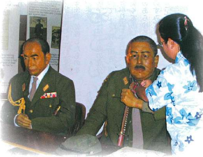
リアルなろう人形像▲

セントーサ島中央の展示館、アイメツジズ・オブ・シンガポールに陳列されていた旧日本軍の山下泰文大将などのろう人形が24年ぶりにそろって同島の岬のフォート・シロソへ引越しをした。フォート・シロソは多数のろう人形を迎えて現在、新装中で、お目見えは7月に入ってからになりそう。 山下大将らのろう人形は1981年8月、「アイメツジズ・オブ・シンガポール」の場所に当時、ろう人形資料館のワンシーンとして展示されたのが始まり。この場面は1942年2月、シンガポールを占領した山下中将(当時)が英国側に、「イエスカノーカ」と降伏を迫るシーンを描いたもの。