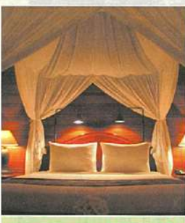
プリウランダリ: 幻想的な部屋

ホテルの敷地内や隣接した所にホテルオーナー所有の広大なライステラスの景観を楽しめます。今年オープンしたので、オープンングレートがあり、お得な価格で宿泊できます。