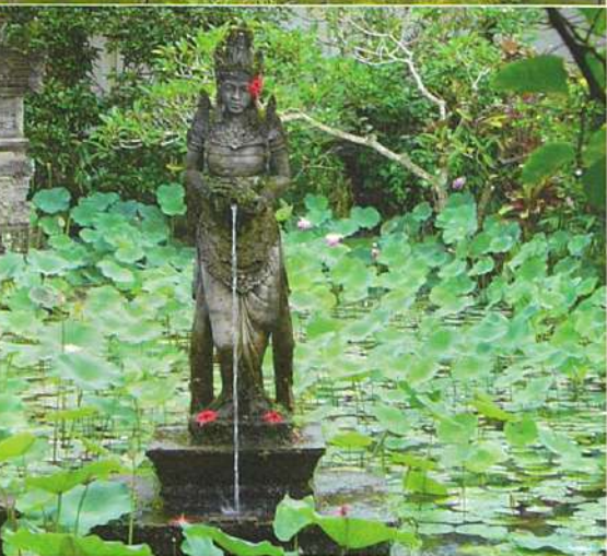
上●テガララン: 太陽の光を受けると緑が輝く 下●プリルキサン美術館: バリらしい雰囲気銅像と蓮池