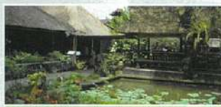
水辺に面した席と棧敷席(右側)

ウブドのランドマーク、市場や王宮からほど近いカフェです。美味しいダツクの薫製が有名で、多彩なローカルメニューやお酒も揃い、いつも観光客で賑わっています。オープンエアなので、涼しく爽やかな目の前のウオーターパレスがよく見渡せます。舞台が開演される夜は、奥の棧敷席で幻想的なダンスパフォーマンスを眺めながら、贅沢に食事を楽しむことができます。