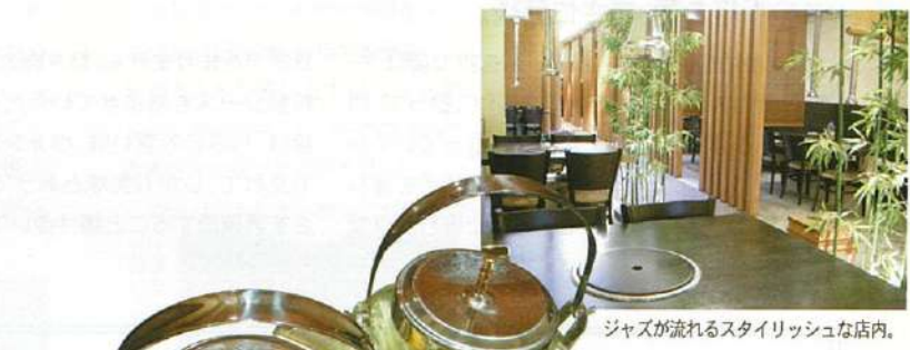
ジャズが流れるスタイリッシュな店内。

Rendezvous Restaurant #02-02/03 Hotel Rendezvous Gourmet Gallery 9 Bras Basah Rd Tel: 6339-7508 11:00~21:00