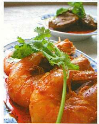
左●新鮮なエビの持つ甘みとソースの辛さが絶妙の「ブラウン・サンバル」(6ドル〜)。ココナッツミルクとスパイスで煮込んだ「ビー・レンダン」(380ドル〜)。 下●店頭ガラスケースをのぞいて料理を注文。