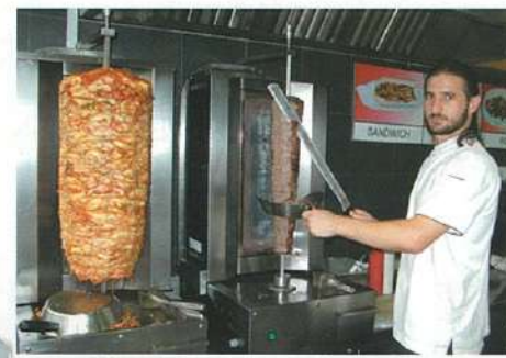
上●黒胡椒風味のビーフは夕方には売り切れるので、お早めに! 右下●3人のトルコ人シェフが切り盛りしています。

The Cathay Restaurant 2 Handy Rd #02-01 The Cathay (MRTドービー・ゴート駅より徒歩3分) Tel: 6732-7888 (予約受付) 11:30~15:00, 18:00~22:30 (日曜は10:00~15:00, 18:00~22:30) http://www.thecathayrestaurant.com.sg/