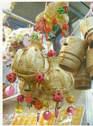
総菜屋さんで売られていた幸運を祈るための龍製品。