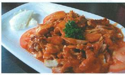
ヨーグルトを添えた、イスタンブール・ケバブ(写真はチキン)は8ドル。