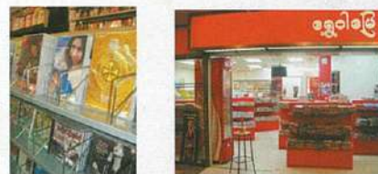
ミャンマーの品揃えも豊富

2Fと3Fの2店舗があり、リトルミャンマー1の広さを誇る。実は地下レストランオーナーの家族が経営する雑貨店。多くの雑貨店でミャンマー人が民族衣装用に使う生地が売っているが、ミャンマー製ではなくインドネシア産のバティックが多い。