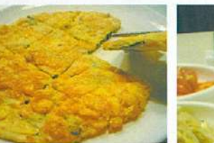
左から順に、「石焼ビビンバ」(16ドル)、「冷麺」(16ドル)、「海鮮チミ」(15ドル)。それぞれ2~3人前のボリューム。 右●韓国料理といえばコレ! 「牛カルビ」(24ドル)。料理を頼むと自動的に付く副菜はもちろん無料でおかわり自由。各種キムチ、エゴマの葉の醤油漬け、小魚の佃煮、もやしのナムルなどから日替わりで出てきます。