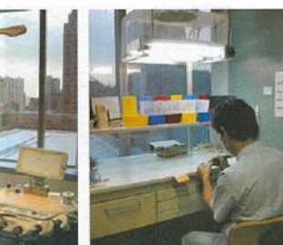
院内感染対策も万全の診察室。 腕が良いと評判の歯科技工士さん。

待合室には日本の雑誌の最新号が揃い、待っている間もリラックスできそう。総合医療の健康診断と一緒に歯科検診を受ける人も多いそうです。