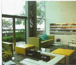
27フロアから成るクリニック。患者さんが増え、待合室を増設中。

チェアの前に用意された画面には、デジタルX線で撮影したレントゲン写真がすぐに映し出されたり、治療に関するDVDが流れたり、ハitekを駆使した診察室で、快適スムーズに治療を受けられます。土、日曜日の診察もOK。日本語通訳も万全です。