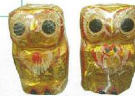
漆器の象、聖なるフクロウの置物などいたるところでミャンマー発見。

MRTシティホール駅からとことこ歩いて約3分、同じアジアの未知の国ミャンマーを初体験！地下にレストラン、3階にbuffetスタイルの食堂があるほか、20~30店ほどの輸入雑貨店、民芸品店や仏具店などがあり、親しみやすく小柄で幼顔のミャンマー人たちが集う。手頃な値段で、英語表記メニューがあるミャンマーレストランはマストトライ。輸入雑貨店で即席食材を買って、家でミャンマーフードを試してみるのもいい。