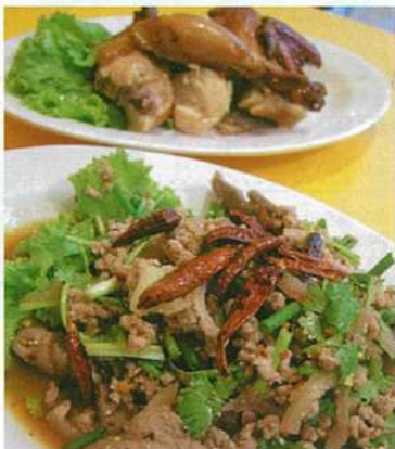
スパイスが豚肉の内臓炒め(5ドル)とかわり焼き上げられたチキン(5ドル)。