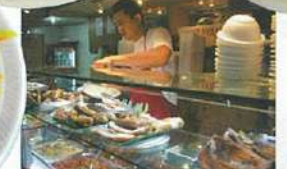
レストランKABAYANでは、ガラスケースに並んだ料理を指さしてオーダー。

上●タマリンドなどの酸味が効いたとんこつスープ「シニガン」(4ドル)は、濃厚な味わい。 左上●中草妙めに似た野菜たっぷりの「チョブスイ」(4ドル)。 左下●外側だけカリッと揚げたボリュームのある豚肉料理の「リジョン・カワレ」(5ドル)。