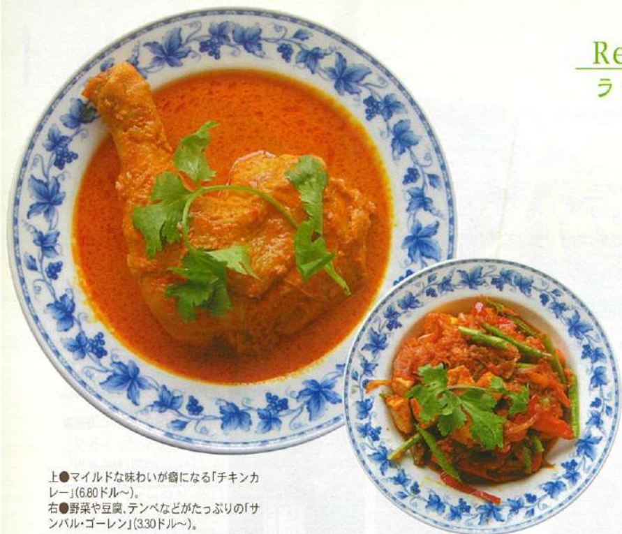
上●マイルドな味わいが癖になる「チキンカレー」(680ドル〜)。 右●野菜や豆腐、テンペなどがたっぷりの「サンバル・ゴーレン」(330ドル〜)。

インドネシア・パダン地方発祥の伝統料理を食せる一軒。メインはなんとと言ってもカレー。インドやタイ、もちろん日本とも違うスタイルのカレーで、辛さは舌に残るけれど、なんともさわやかな後味にひびく。独自にブレンドする幾種類ものスパイスが絡み合い、カレー好き必食です。これは、創業58年の老舗「ランデブー・レストラン」が守り抜いてきた自慢の調理法が成せる技と、注文方法は、ガラスケースの中の料理を指さしてオーダー。ピーフ、チキン、魚介、野菜など様々な料理を小皿に入れてもらい、みんなでシェアして楽しんで。在りし日のシンガポールの写真があちこちに飾られ、壁のタイル使いもノスタルジックな、店の雰囲気も魅力です。