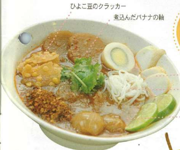
ひよこ豆のクラッカー