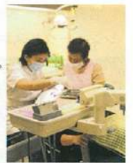
なるべく歯を保存するための根の治療は、世界レベルの技術。

の盛り上がりまでキレイに見えます。顕微鏡を使うことで、肉眼のみでは得られなかった的確な治療を行い、隙間にばい菌の集合住宅を作らないようにしてくれます。また医師は皆、なるべく痛くない治療を心掛けており、女医さんは子供に優しく説明しながら治療してくれます。