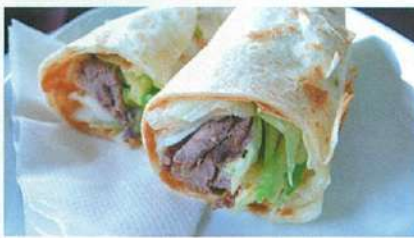
お持ち帰りにも人気のサンドイッチやロール(写真はビーフ)は5.5ドル。