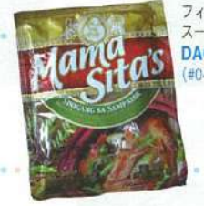
フィリピンを代表する酸っぱいスープ「シニガン」の素(1.5ドル)。 DAGUPAN TRADING (#04-109)

KABAYAN FILIPINO RESTAURANT : Lucky Plaza #03-25 Tel: 6738-0921