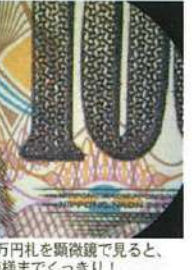
日本の1万円札を顕微鏡で見ると、細かい模様までくっきり！

でも、ばい菌にとってはコンドの敷地ぐらいに相当します。顕微鏡で日本の1万円札を見せてもらってビックリ。小さな文字や