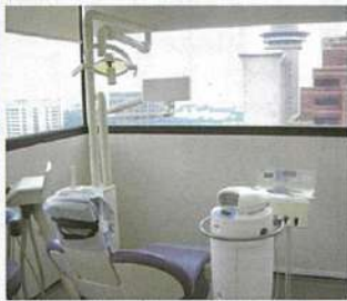
ホワイトニングの機械が置かれた診察室。