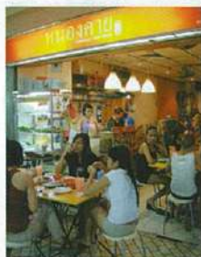
右●タイの代表料理のひとつ、パパイヤサラダ(5ドル)。下●お店から溢れださんばかりのお客さん。

すっぱ辛いタイ北部の伝統料理 オレンジ色の看板が目を引く一軒。きれいな店内にはお客さんがいっぱい活気十分。「すっぱ辛い」とはいえ、日本人でも食べやすい味付けで、食が進む。もち米とおかずと一緒に食べるのがラチャニーさん流。