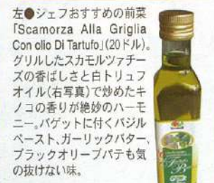
左●シェフおすすめの前菜「Scamorza Alla Griglia Con olio Di Tartufo」(20ドル)。グリルしたスカモルツァチーズの香ばしさと白トリュフオイル(右写真)で炒めたキノコの香りが絶妙のハーモニー。バゲットに付くバルベスト、ガーリックバター、ブラックオリーブパテも気の抜けない味。 上●「Risotto Allo Zafferano E Broccoli」(19ドル)。プロクローとホタテ、エビのサフランリゾット。 左上●「Arrostato Di Agnello al Rosmarino」(34ドル)。オープンでローストしたラム肉のローズマリーソースがけ。 下●近隣に住む日本人のリピーターも多い。

バルティ読者限定プロモーション ディナータイム(18:00~22:00)にご来店のお客様全員にスパークリングワイン「proscio」を1杯サービス。 さらに、1テーブルに付き「特別アベタイザー1皿」または「自家製ティラミス1皿」をサービスします。 ※プロモーション利用時にバルティをご提示ください。(5月末まで)