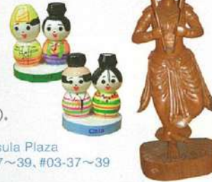
家簡単モヒンガー(0.70ドル)。