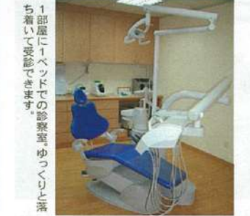
1部屋に1ベッドでの診察室がゆとりよく、清潔に保たれています。

口のレントゲンから診察、治療、投薬まで、ワンフロアで行うため、移動が少なく快適です。また、5月に導入予定の口腔内カメラは、ペン型のCCDカメラでとらえた口の中の様子を、診察台横のモニターですぐに確認できる優れもの。口の中の汚れや虫歯、治した場所などを、モニターで確認しながら先生の説明が聞けるので、納得のいく診療が受けられます。