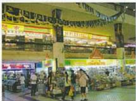
お金の送金や、本場タイ料理の味を求めて、多くのタイ人が訪れる。