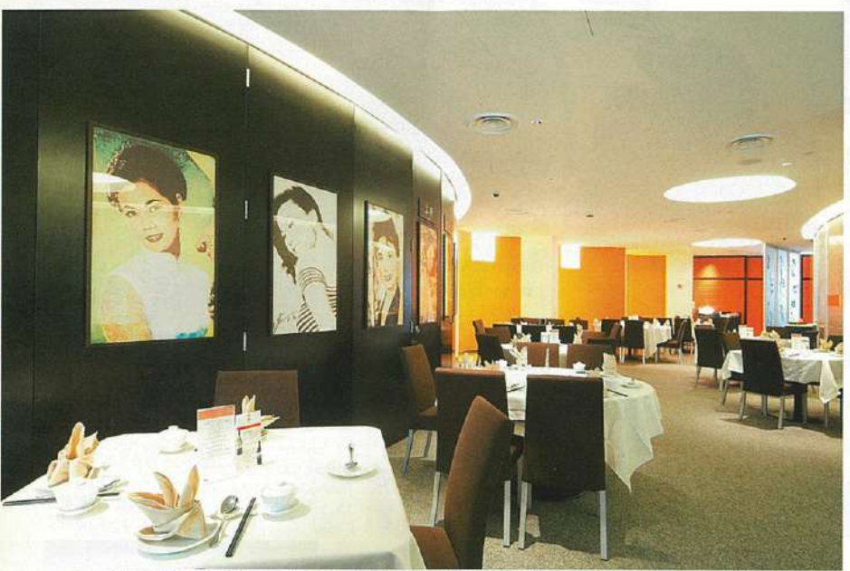
60~70年代の銀幕スターのポスターが飾られたノスタルジックな店内には190席。

脂のつってジューシー。サメや鶏の骨を四〜五時間かけてじっくり煮込んだスバゲッティスカッシュスープは、白濁したスープに複雑な味わいが溶け込んだ逸品。身の部分がフカヒレそっくりのウリの仲間、スバゲッティスカッシュの器に盛られ、濃厚なスープと身の身を一緒に味わえば、歯触りもテキストもまるでフカヒレ! ソテーしたパンブークラムの kori コリとした食感とサボンのピターな味わいが調和した「パンブークラムのザボン」添えもシンガポールならではの味。 ザ・キャセイレストランは現在も新しい食材を取り入れた創作中華で、食の東西交流を実現し、私たちに美味しい驚きを味わせてくれます。