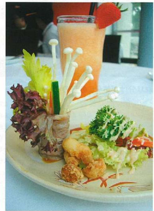
冷製牛肉のサラダ巻き(60ドル)。