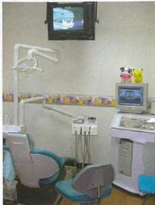
可愛らしくコーディネートされたキッズ専門診察室。

ニーアンシティという好立地に、水と木を用いた癒しの待合室を持つ歯科クリニックがあります。15年にわたり多くの日本人患者を診てきた実績があり、今なお口コミで人気が拡大中。その理由は、的確な診断、高い歯科技術力、そして誠実できめ細やかなケアです。初診時に、治療内容、コスト、期間などを細かく明記した治療プランを作成。日本人スタッフのサポートもあるので、不安なく診察に臨むことができます。