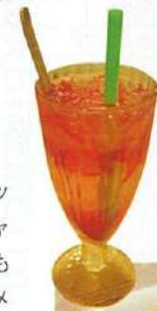
右●お茶の葉を使った甘酸っぱいサラダ「Pickled Tea Leaves Salad(Laphet Thoat)」(4.90ドル)。エビ、トマト、豆、ピーナッツなど具沢山。 左●つばめの果ドリンク3ドル。ミャンマービール(6ドル)もある。 下●「Myanmar Crispy Tofu」(4.90ドル)、黄色い豆腐の揚げ物。