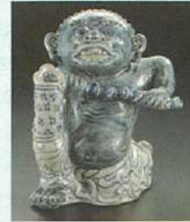
Kneeling figure: stoneware, 15c North Vietnam

Viet Nam! From Myth To Modernity 「ベトナム! 神話から現代」