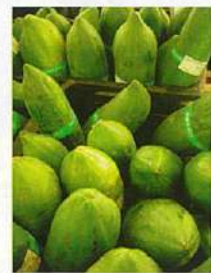
タイ産の巨大なパパイヤ。