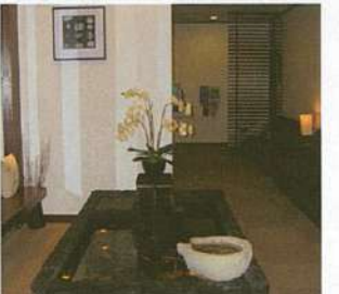
優雅に泳ぐ池を備えた待合スペース。

医師陣は一般から専門まで広い守備範囲。歯科検診から小児、矯正、インプラント、神経、外科等、マルチな治療を1か所で受けられるので、時間と通院回数の軽減になります。