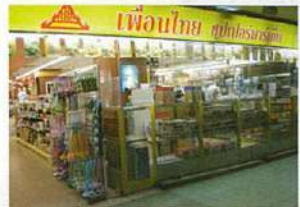
2階にある大型スーパーには、タイ製品のほか、ベトナムや韓国のもも。食品から雑貨まで揃うので、見て歩くだけでも楽しい。