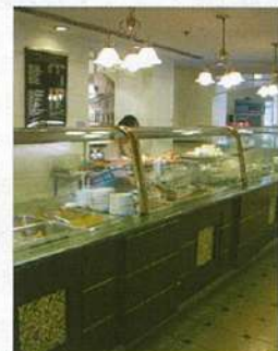
下●ホテルに隣接したビル内の店舗は、広くて趣のある雰囲気。