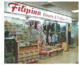
食品から衣服、コスメなど何でも揃う雑貨店がいくつもあ。

上●タマリンドなどの酸味が効いたとんこつスープ「シニガン」(4ドル)は、濃厚な味わい。 左上●中草妙めに似た野菜たっぷりの「チョブスイ」(4ドル)。 左下●外側だけカリッと揚げたボリュームのある豚肉料理の「リジョン・カワレ」(5ドル)。