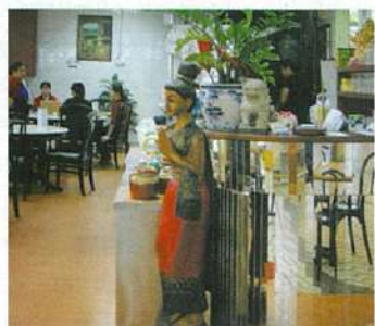
右●入口ではタイ人の人形がお出迎え。 左●定番トムヤム・シーフード・スープ(7ドル)とグリーンカレー・チキン(8ドル)。

リトルタイの本命レストラン 「美味しい店は？」と聞くと、誰もが口を揃えて教えてくれたのが、ココ。正統派タイ料理をちゃんとしたレストラン・スタイルで食せる人気店。