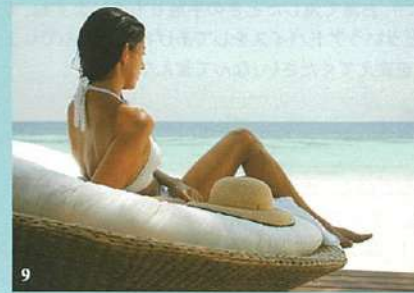
9.客室のデイ・ベッドから眺める穏やかな海はいつまでも見飽きない。(H)