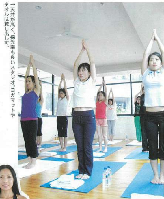
↑天井が高く、採光率も良いスタジオ。ヨガマットやタオルは貸し出し可。