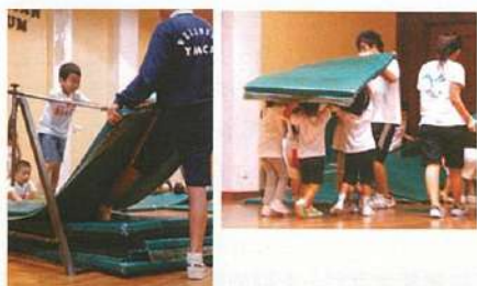
←左:鉄棒で逆上がりチャレンジ。今日はいまできるかな? ←右:運動マットの後片付けもみんなで一緒に。こうした経験を通して協調性を身につける。