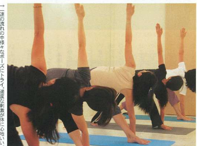
↑二連の流れの中様々なポーズにトライ。適度な刺激が体に心地よい。

バルティ読者限定プロモーション 新規お申し込みの方に10ドル分のチケットをプレゼント! 「バルティを見て」と一言。(2009年4月末まで)