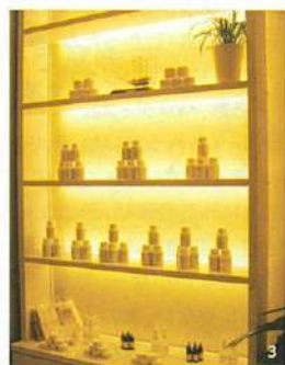
3. スプレータイプ、スポイトタイプ、軟膏などポータブルでできる漢方薬。成分は薬草のみ。