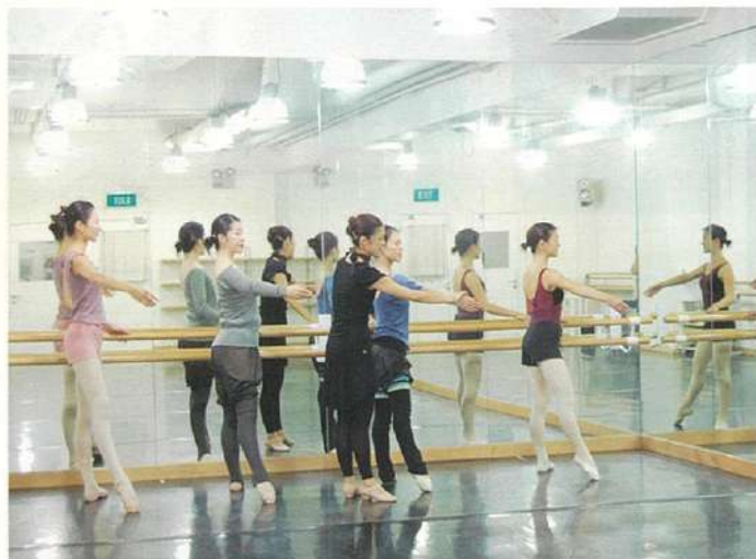
↑大人初級クラスのバレレッスン風景。