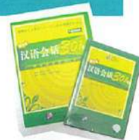
CD付テキストは、 自宅での復習にも 便利。