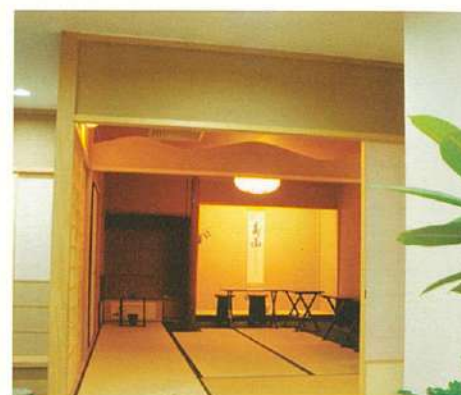
↑リャンコート2階の裏千家茶室。ふんわりと漂う香りに気が落ち着きます。

子供がプールでおぼれた! 意識がなくて、息もしていないみたい。そんな時、あなたならどうしますか? 心肺停止状態の場合、停止から数分間の対応が救命率を左右するといわれています。そこで、救急車が来るまでに処置を行う、市民救助者の存在が肝心。 正しい知識があれば、誰でも市民救助者になれます。講習会では、日本人講師による説明と人形を使った実技で、心臓マッサージや人工呼吸などのCPR(心肺蘇生法)と、AED(自動体外式除細動器)の使い方などを楽しく学びます。 自分磨きもいけれど、素敵な大人のたしなみとして、今度は「人助け」を習ってみませんか?