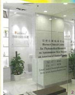
1. 唐医師。取材中も問い合わせの電話が続く。 2. 漢方診療所には見えないモダンな外観。