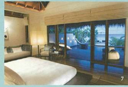
7.シックなインテリアの「Deluxe Beach Bungalow」。プライベートプール付き。(H)