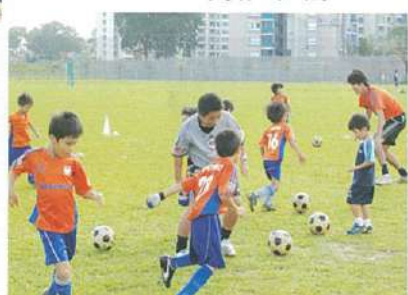
↑友達のを広げてくれるサッカーボール。

→JFA公認ライセンスを持つコーチによる指導だから安心。飲料水、ボールも完備。 ↓サッカー専用スタジアムでプロの選手と練習できるのも当スクールならでは。