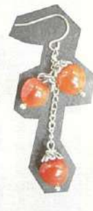
サガの実をビーズとして使ったピアス。

物づくりに集中することがこんなに楽しかったとは！今回、シルバークレイに初トライした編集A。自分でデザインを描き、自由に形を創っていく作業に魅了されてしまいました。童心に帰って手を動かしていると、心もほぐれていくから不思議です。