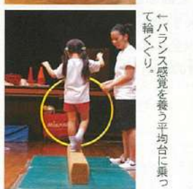
←バランス感覚を養う平均台に乗って輪くくり。