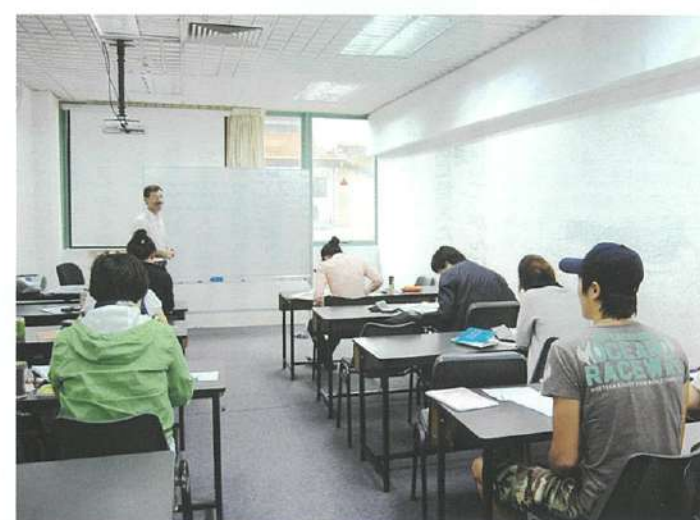
↑フルタイムのクラス。アジア各国の留学生とお友達に。