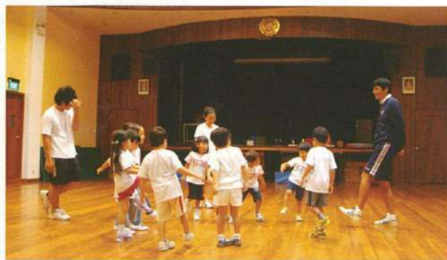
←スポーツ教室ではお友達やリーダーたちと一緒に様々な運動遊びを体験。子ども達の顔に笑顔がこぼれる。