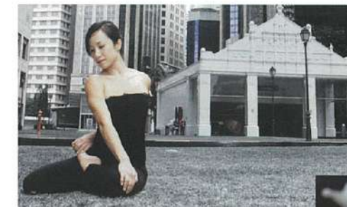
←「ヨガは人生の勉強」と話すウェンリー先生は本場インドや米国でも修行経験をもつ、8年間の日本留学経験があり日本語も堪能。 ↓コースのときでもクレンジングが習えます。

バルティ読者限定プロモーション 新規お申し込みの方に10ドル分のチケットをプレゼント! 「バルティを見て」と一言。(2009年4月末まで)