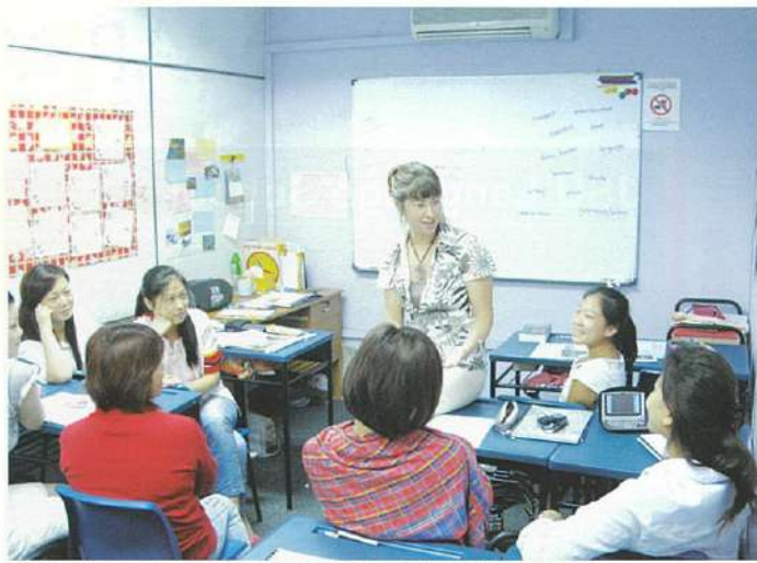
↑英国出身ミカエラ先生のクラス。先生との距離の近さも嬉しい。