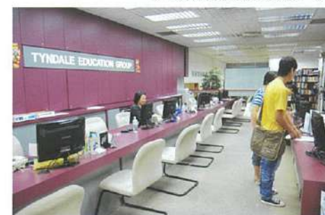
↓1990年開校の歴史あるスクール。