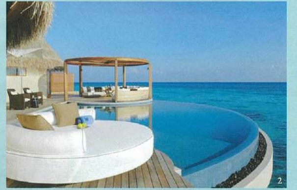
1.モルディブとは古代インドのサンスクリット語「Malodheep」（=鳥々の花輪）に由来するといわれる。上空からみた各島はなるほど、珊瑚礁が連なる美しい花の輪だ。(W) 2.水上コテージ「Ocean Heaven」。デッキのソファで寛ぎの時間。暑くなったらラグーンの中に直接ダイブ。(W) 3.ラウンジで夕暮れを眺めながら、食前にカクテルを一杯。(W)