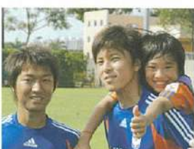
一子どもたちとの練習を楽しみにしている選手も多いとか。