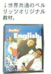
↓世界共通のベルリッツオリジナル教材。