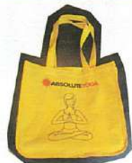
←左: 在星歴の長いSANA先生。ホットヨガ好きが高じて講師に。SANAさんのブログ http://antara.exblog.jp ←右: 特製バッグ12ドル。