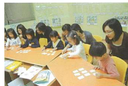
→プログラムは心理学者や各言語講師が集結し、シンガポールで開発。