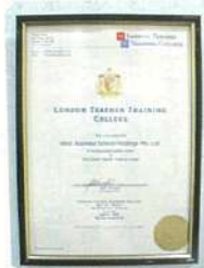
London Teacher Training Collegeの英語講師資格が取得できます。