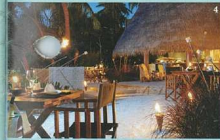
4.トーチの炎がロマンチックな屋外レストランで海風を感じながらディナー。(W) 5.「Beach Oasis」は2フロア188㎡の完全プライベート空間。2階デッキから海も望める。(W)