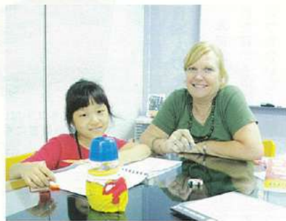
↑英国出身ヘザー先生のプライベートレッスン。お子様の英語力UPにも◎。

プロモーション実施中! Diploma in TESOL (英語講師資格) 2900ドル(通常4900ドル) 6週間/1日3時間/週5回 ※4月30日まで有効。