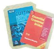
↓テキストは、人気のカッティングエッジやケンブリッジなどを使用。

一度入校したら長く通う生徒が多いティンデール。その理由は、多彩なコース展開にあり! とことん派ならフルタイム、無理なく楽しくやりたい派ならパートタイムと、2つのまったく雰囲気の違いの選択肢があります。さらに興味対象のパートタイムには4種のクラスがあり、グラマー中心、テキストに沿った初級英語、シーン別英会話など、自分の苦手分野を集中的に学べます。とくに日本人の女性講師のクラスは、初心者に好評と日本人コディネーターがいるのも心強いポイント。どうやら英語が上達する、一緒に真剣に考えてくれるスクールです。