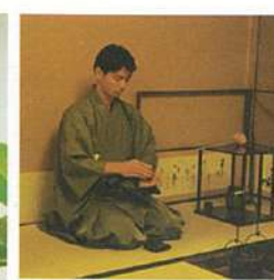
↑お茶をたてるのはローカルの生徒さん。日本人顔負けのお手前。