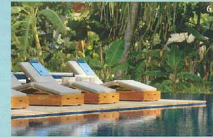
6.緑に囲まれたプールサイドでのんびりと。(W)