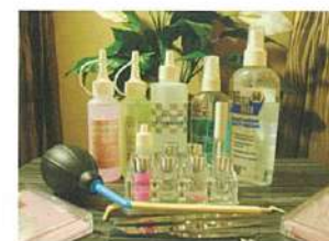
↑パーマ液など材料はすべて日本製。最新のシリコン・ロットの使用法も伝授。 →講師は指導資格をもつ同店の岩崎さん。「誰かをきれいに করতে 素敵な仕事。お友達と一緒にトライしませんか」。

※日本語による指導、各クラス定員4名まで。 ※4月開講は上記2クラスのみ、2回目以降の日程および5月以降の開講についてはお問い合わせください。