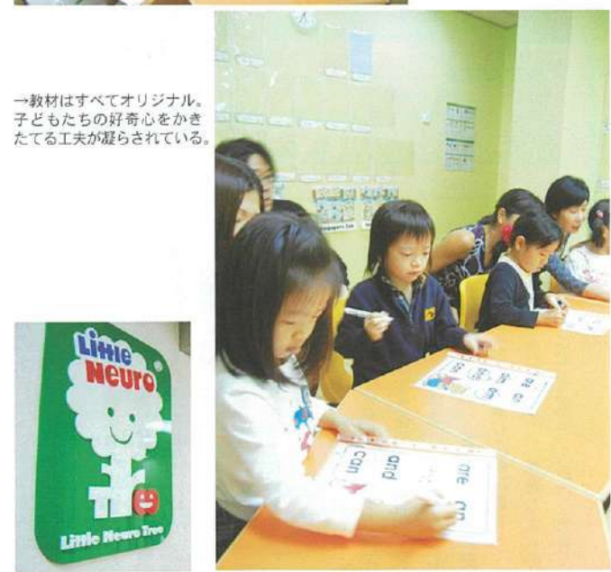
→教材はすべてオリジナル。子どもたちの好奇心をかきたてる工夫が凝らされている。