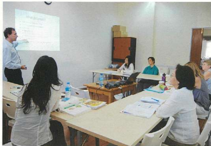
↑落ち着いた雰囲気のあるショップにある教室。試験もここで受けることができる。