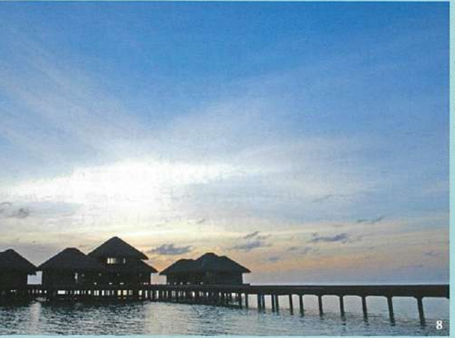
8.インド洋に浮かぶスパへは棧橋から、目を見張るほど美しい夕日をひとり占め。(H)