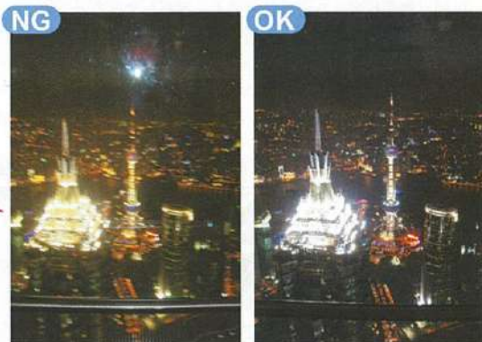
オート設定での撮影。

ガラス越しに夜景をオート設定で撮影したところ、ひどい手ぶれとフラッシュがガラスに逆反射。設定を変えたら夜景も比較的リアルに再現。