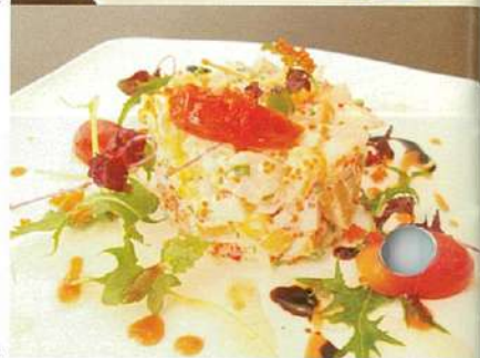
1. セットランチ(全3品、ドリンク別)の一例。鶏肉のローストはケイジャンソースを絡めて、スープ、デザートも絶品! 2. シーフードとマンゴーをレモンベースのドレッシングであえた前菜「マンゴザルサ」。