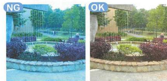
白熱灯モードの設定