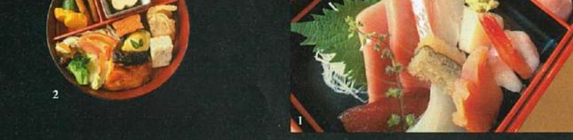
1. 刺身、握り寿司、焼物、珍味、お吸い物、デザートが供される雅弁当(85ドル)。1つ1つがまさに「雅びやか」なお味。2. 「提灯弁当」(55ドル)。1段目には生ちらし、2段目は焼魚、珍味、サラダなど。食べるほどに楽しさが増す。3. 瓢箪(左)や提灯(右)など同店の漆器はずっと大切に使われてきた貴重なもの。

漆器の蓋をそっと開くと目にも鮮やかな食材。味わう前からワクワクする、そんな玉手箱のようなお弁当を楽しめるのがここ「白石」。「1段ずつ開けると、楽しさが増すでしょう？」とはご主人・白石さんの談。瓢箪、提灯……。粋なかたちのお重に