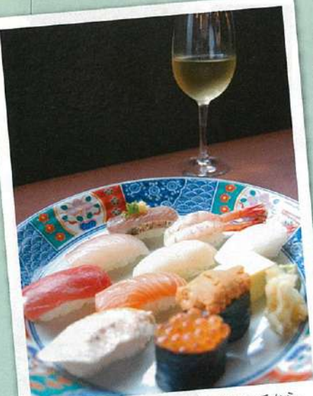
↑相性ぴったりの寿司とワインをランチから。こんなに幸せでいいのかしら、あたし。