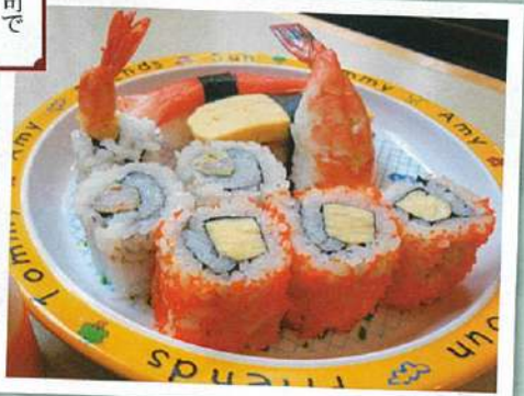
↑キッズ向けのメニューで親子一緒に寿司ランチを楽しもう。

お寿司のお子様メニューがいただける「一番亭」。エビやタマゴの握りのほか、稲荷寿司など子どもが大好きなネタを「キッズ寿司セット」(12ドル)にお腹にやさしいヤクルト付き！