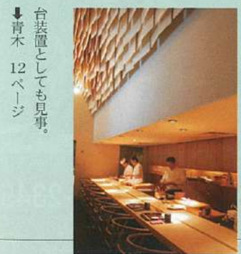
↑さすが「Yチェア」。座り心地がいいから、つい長居したくなっちゃうかも！