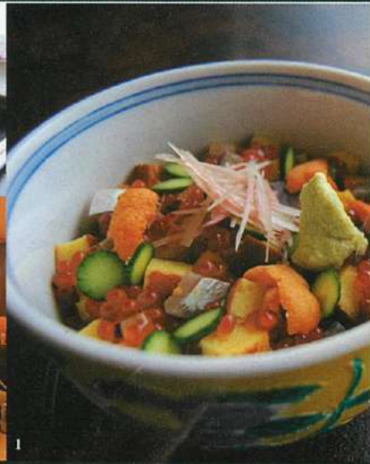
1. 自慢のトロ、ウニ、イクラなど、極上素材の「混ぜちらし」(35ドル)。2. この日の大トロと中トロは、青森県深浦産。福島県聖ガレイ、鹿児島県錦江、北海道のホッキ貝など、贅を極めた「ランチ特選」(50ドル)は、サラダ、茶碗蒸し、デザート付き。3. 和モダンな空間。ミシュラン3つ星店から来たソムリエも常駐。4. 生のまま水詰めして届くマグロに出合えるのは、当地ではここだけ。