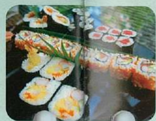
↑「Zen」では8月から寿司の価格大幅下げ！

和ダイニング「蔵の中」で、寿司とワインを一緒に楽しめる。お値打ちレディースセット(税込28ドル、38ドル)が8月からスタート！昼からほろ酔い、たまにはいいでしょ？