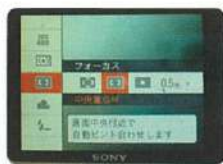
中央の花の部分にピント設定。