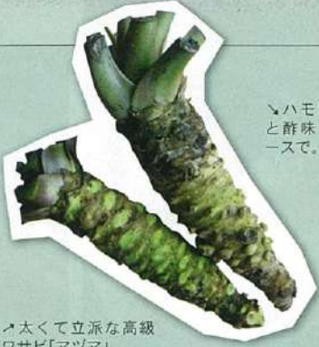
↑太くて立派な高級ワサビ「マツマ」。