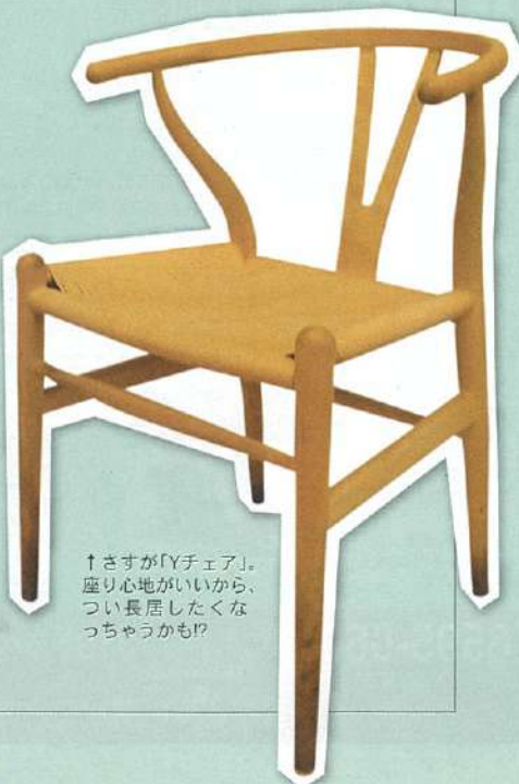
↑さすが「Yチェア」。座り心地がいいから、つい長居したくなっちゃうかも！