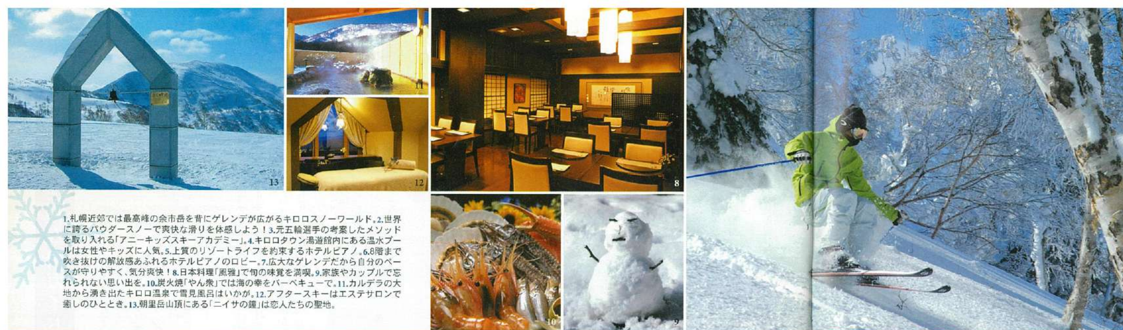
1.札幌近郊では最高峰の余市岳を背にゲレンデが広がるキロロスノーワールド、2.世界に誇るパウダースノーで爽快な滑りを体感しよう！3.元五輪選手の考案したメソッドを取り入れる「アニーキッズスキーアカデミー」、4.キロロタウン湯遊館内にある温水プールは女性やキッズに人気、5.上質のリゾートライフを約束するホテルピアノ、6.8階まで吹き抜けの開放感あふれるホテルピアノのロビー、7.広大なゲレンデだから自分のペースが守りやすく、気分爽快！8.日本料理「風雅」で旬の味覚を高嗅、9.家族やカップルで忘れられない思い出を、10.炭火焼「やん衆」では海の幸をパーベキューで、11.カルデラの大池から湧き出したキロロ温泉で雪見風呂はいかが、12.アフタースキーはエステサロンで癒しのひととき、13.朝里岳山頂にある「ニイサの鐘」は恋人たちの聖地。

キロロ——アイヌ語に由来するという不思議な音の響き。 秋が深まるころ、真っ白な雪がキロロに舞い降りる。 この南国から、遙か遠く離れた北の大地では 忘れられない休日が旅人を待ちうけている。