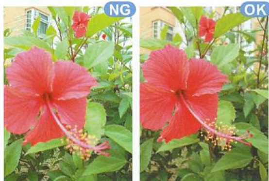
画面全体にピント設定。