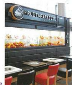
2. カフェとしてゆったり過ごせる「FRUIT PARADISE」店内。夜は売り切れてしまうので、午前中が一番タルトの種類が多いとか。

BOTEJYU 181 Orchard Rd #07-09 Orchard Central Tel: 6509-9921 11:30～22:00 無休