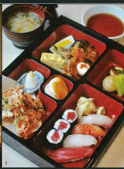
1. 「野川膳」(35ドル)はデザートも付いて、超お値打ち。 2. シンプルなしつらえのテーブル席。 3. 調味料など、脇役たちの品質にも妥協なし。