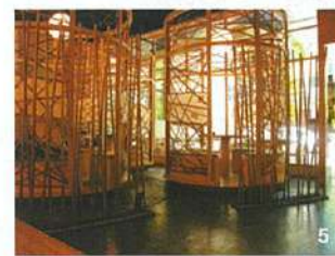
5. 斬新な円筒形デザインの空間でゆったり。平日ランチは予約がベター。

☎ 6837-3960 9 Raffles Blvd 01-11/12/13 Millenia Walk ☎ ランチ12:00～14:30 L.O ディナー18:00～22:00 L.O 無休