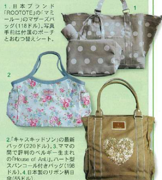
1.日本ブランド「ROOTOTE」の「マミールー」のマザーズバッグ(118ドル)。写真手前は付属のポーチとおむつ替えシート。